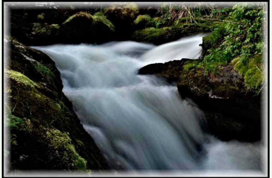
Mølnelva i fint driv.